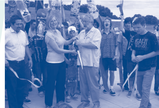
New Skatepark at Phillips Park.

Community involvement is very important, if you want to start your own neighborhood group, call the Alderman's office for help (630) 256-3020.